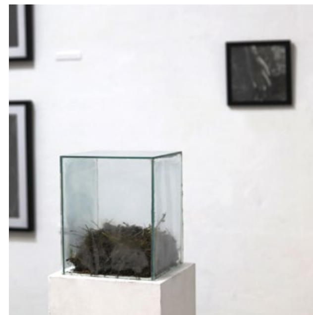
Младен Мићић Без назива 2023, цртеж и инсталација, 24,7 x 25 cm и 30 x 30 x 30 cm