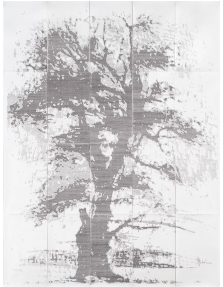
Богољуб Ђоковић Таковски грм 2024, цртеж писаћом машином, 183 x 137 cm