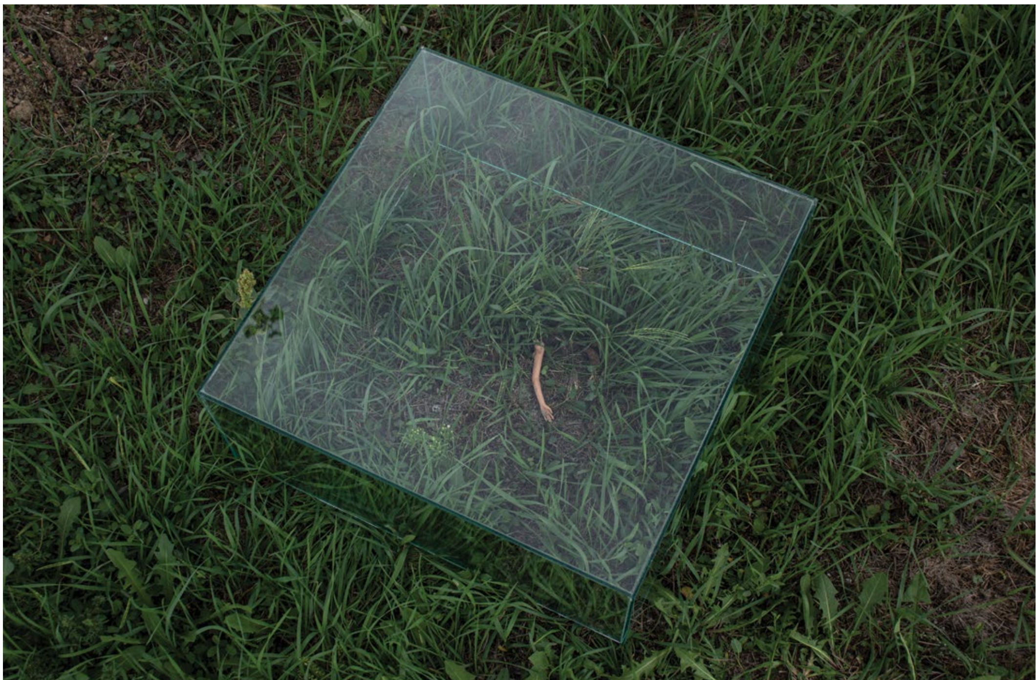
Младен Мићић Без назива 2023, инсталација, 30 x 30 x 30 cm