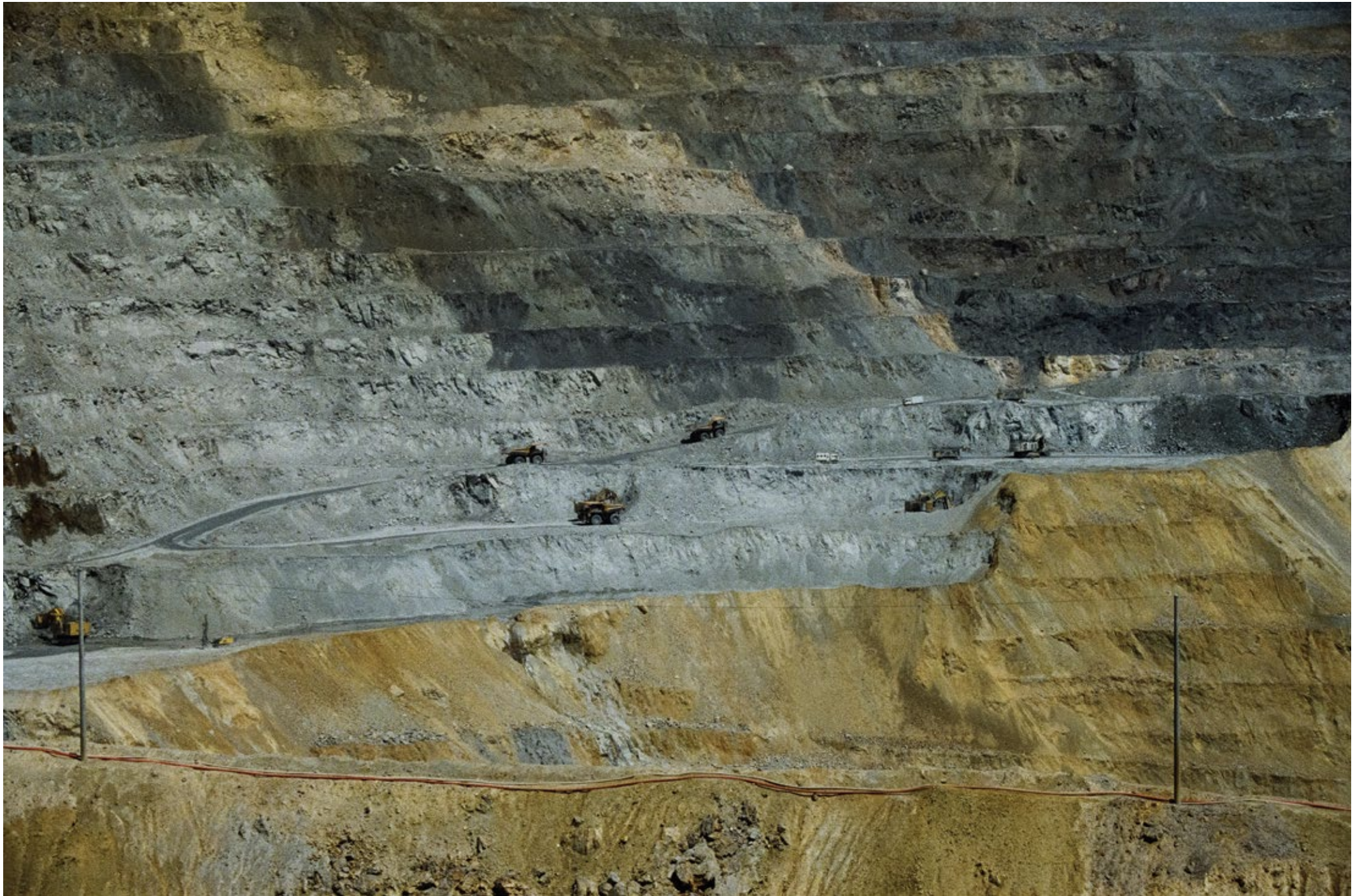
Сања Лaziћ Рударство за боље друштво 2024, видео инсталација, 2'32"