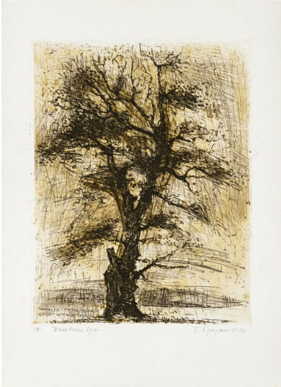
Бождар Продановић Таковски грм 1969, бакропис (E.A.), 52.5 x 38 cm